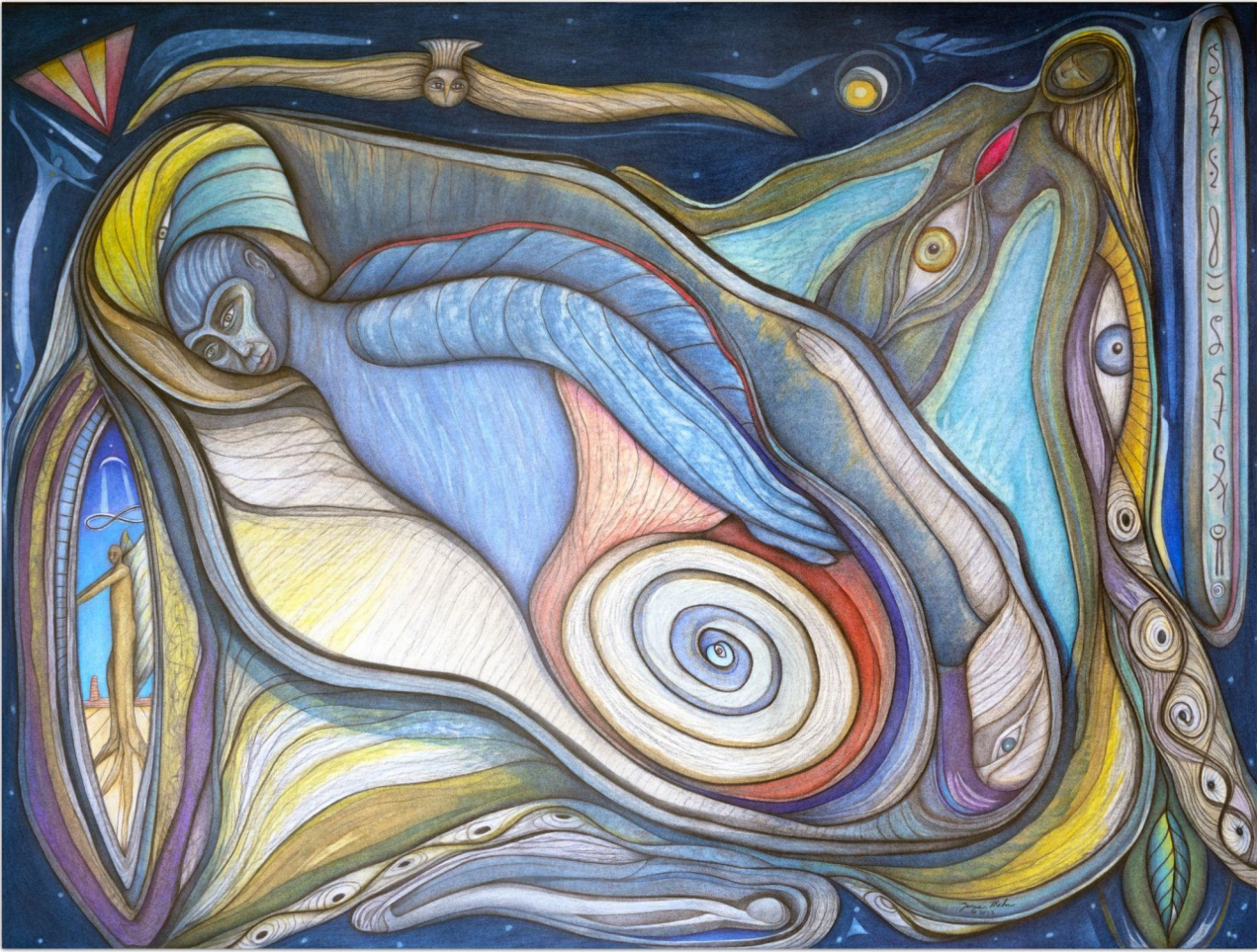
Interpreters of Truth - Interpreti pravdy