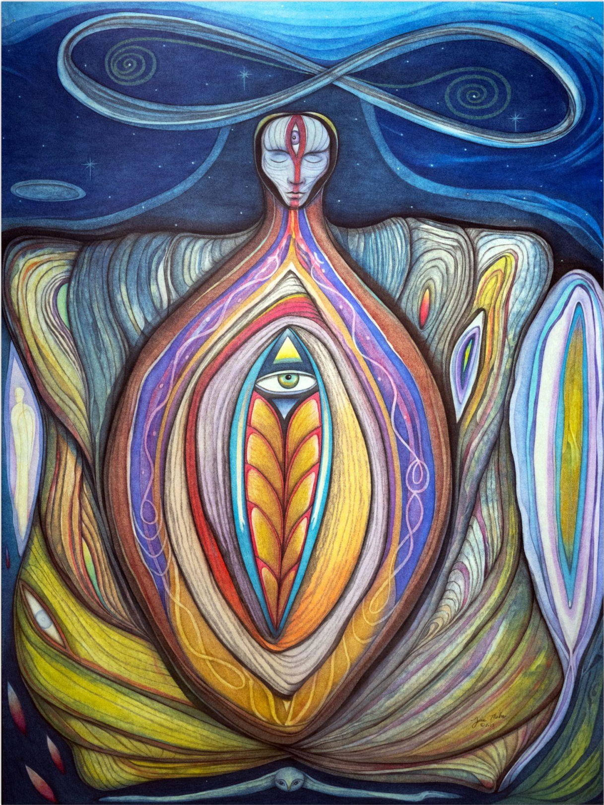
Intricacy of the Integral - Spletitost Integrálu