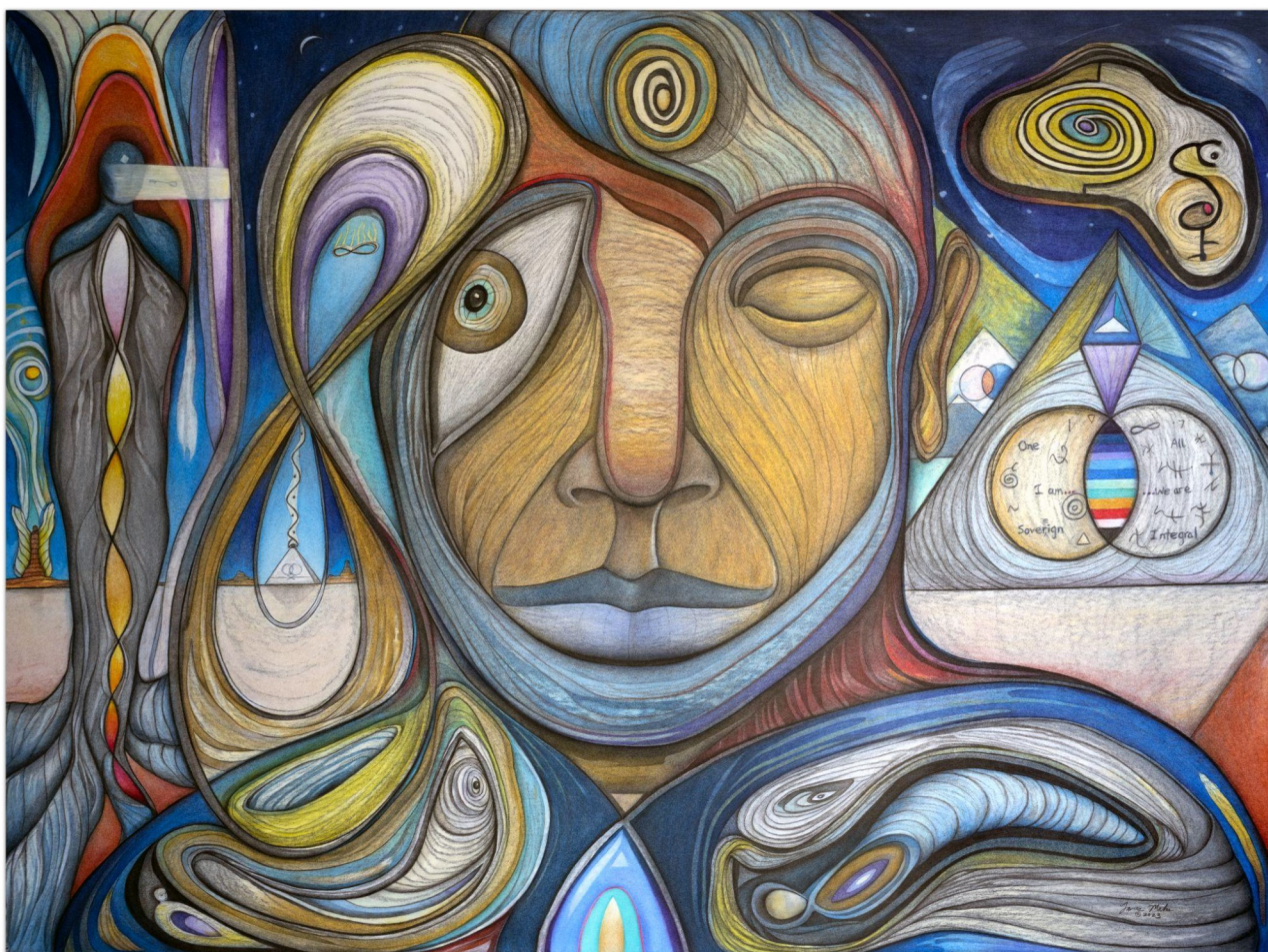
Evolution of Consciousness - Evoluce vědomí