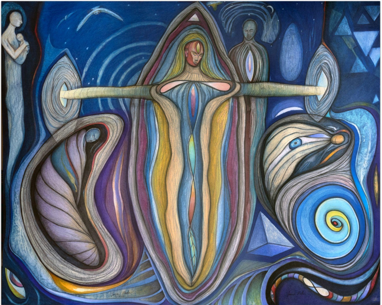
Designing Our Forgetfulness - Designování naší zapomnělivosti