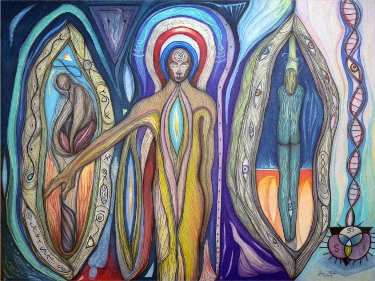
Theater of Life - Divadlo života