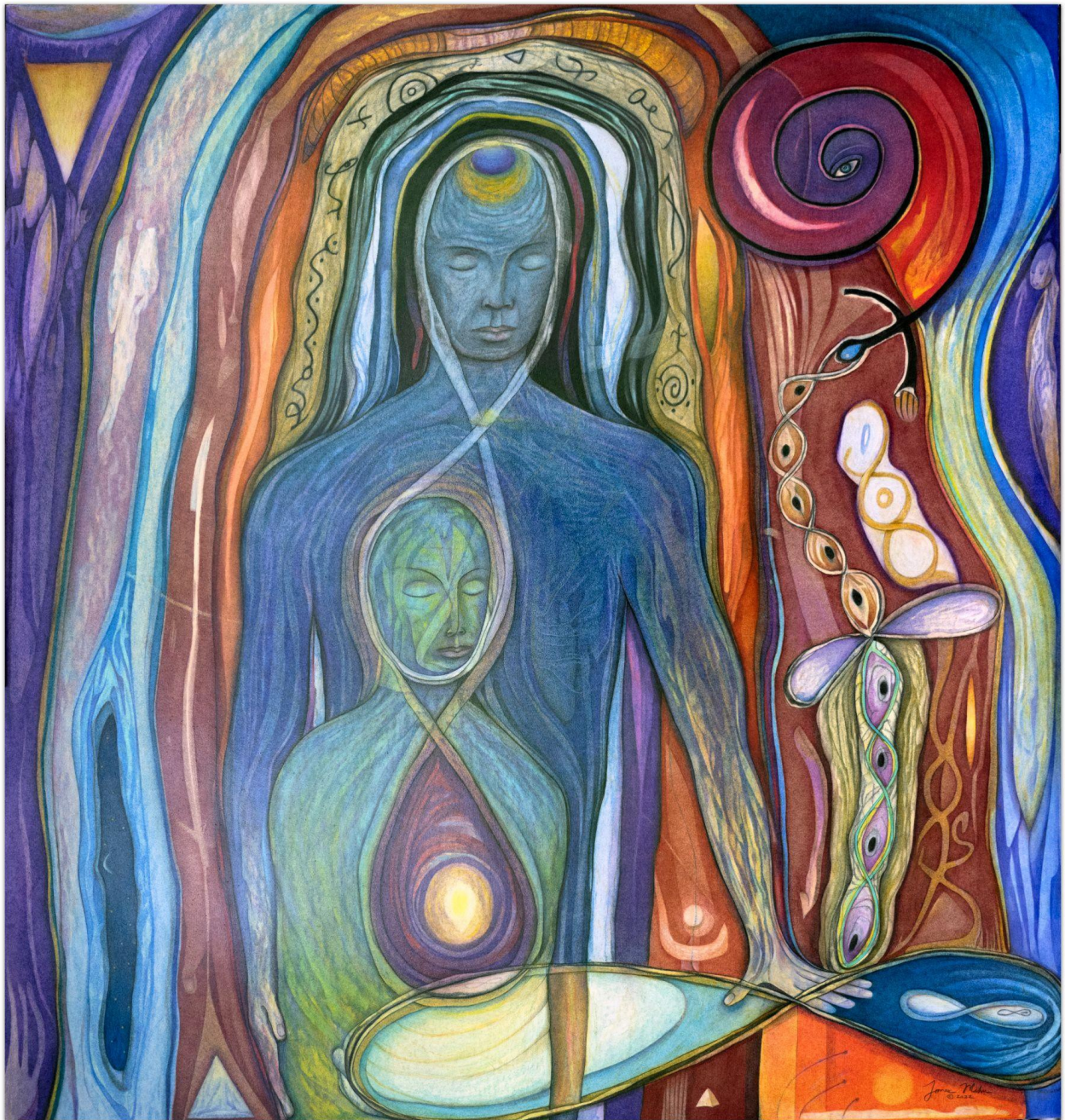
Inmost self - Nejvnitřnější jáství