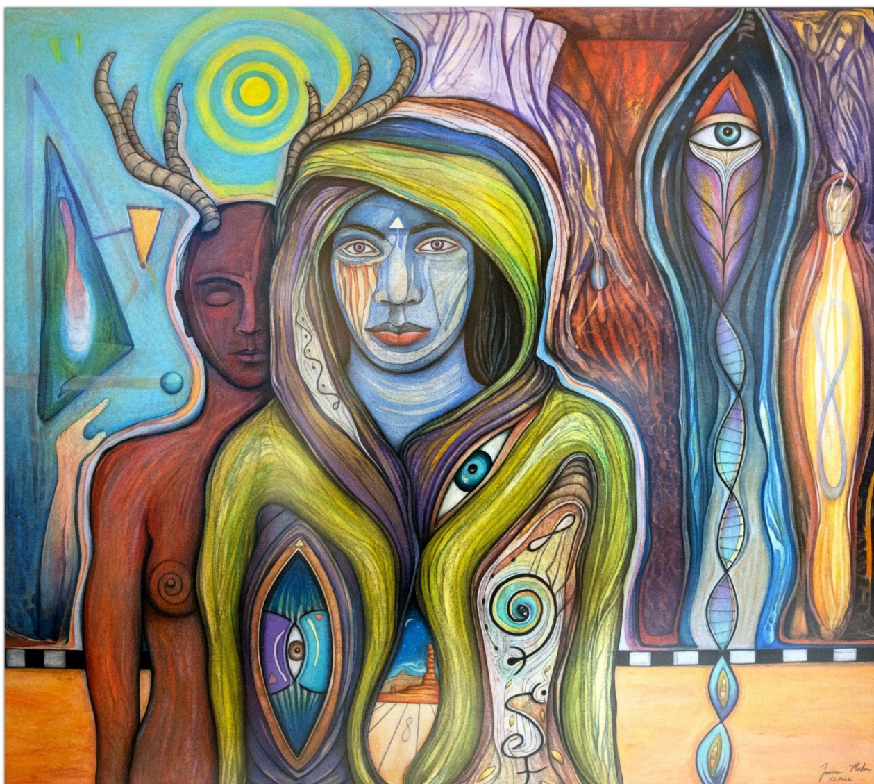
That Which Awakes Us - To, co nás probouzí